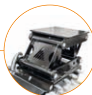
Lámina de acople con dispositivo de auto nivelación (opcional) para ajustarse a todo tipo de terrenos

Soporte de acople con pasadores sobre medidas (opcional)